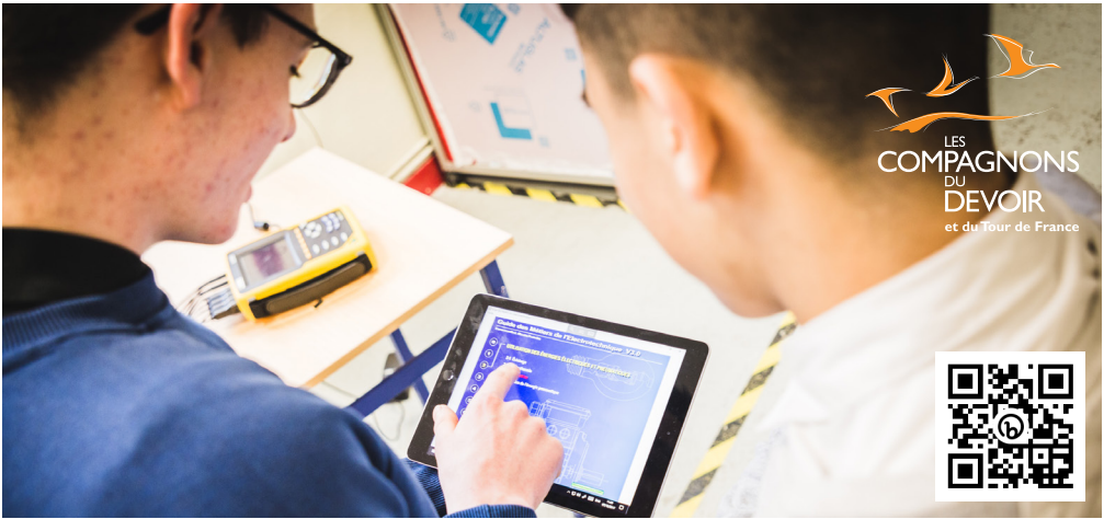
© 04/2022 Compagnons du Devoir - Crédits photos : Thierry Caron/Divergence, Florent Potlier - Ne pas jeter sur la voie publique.

L'électrotechnicien ou l'électrotechnicienne conçoit, met en œuvre et maintient les installations électriques et électroniques. Il/elle assure également les essais et la mise au point des systèmes automatisés, conformément aux normes techniques et environnementales, que ce soit dans le secteur de la production d'énergie, de l'industrie, du tertiaire ou de l'habitat. Dans un monde de plus en plus connecté, l'électrotechnicien doit être capable de suivre les évolutions technologiques afin d'adapter ses compétences.