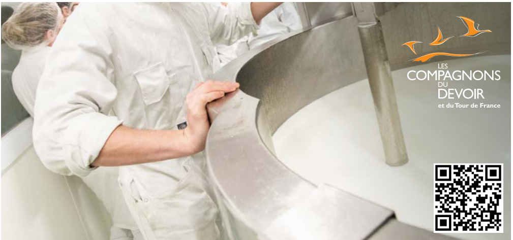
© 10-2020 Compagnons du Devoir - Ne pas jeter sur la voie publique.

Le métier de fromager se déroule en entreprise de transformation laitière industrielle ou artisanale. Le fromager intervient sur les étapes de fabrication des fromages frais ou affinés : filtrage, culture des ferments, mise en forme et affinage. Il/elle assure également les analyses et les contrôles du lait tout au long du processus de transformation. Il/elle pilote les opérations de transformation du produit jusqu'à son conditionnement et son expédition, dans le respect des normes d'hygiène et de sécurité alimentaire.